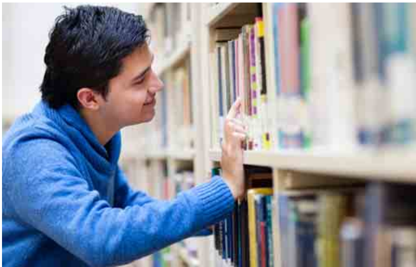
Muchos lectores buscan obras que relaten casos de éxito empresarial que sirvan como modelos a imitar.

Las obras que invitan a la reflexión y a mejorar las propias habilidades son las últimas apuestas de las editoriales. Por Á. Méndez