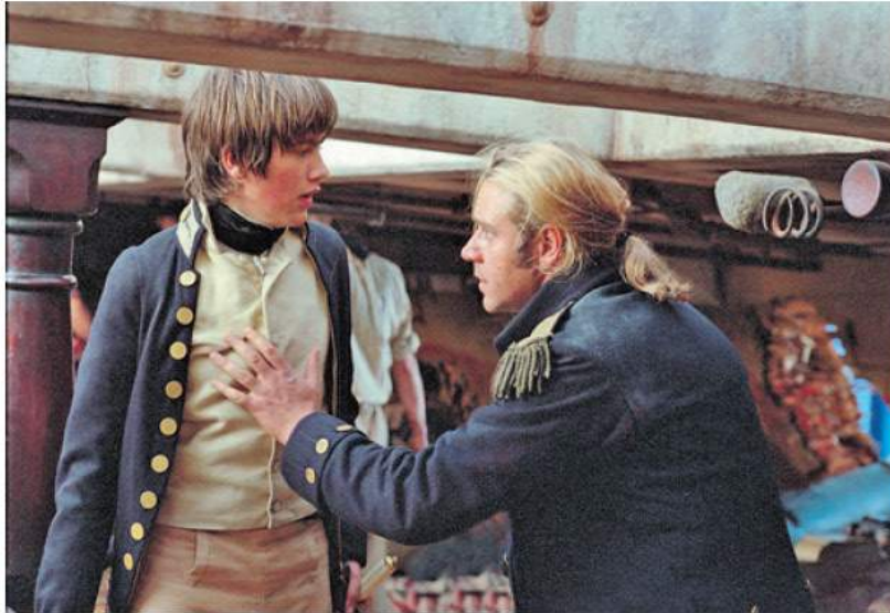
El libro extrae de «Master & Commander» lecciones sobre liderazgo al analizar dudas y decisiones de dos jóvenes oficiales

Los protagonistas dialogantes acuerdan que el trabajo ha de responder a unos valores generalmente admitidos para que el equipo funcione de forma satisfactoria para todos. Esa es la única forma de que cada uno de los integrantes haga suya la misión de empresa, incluso para