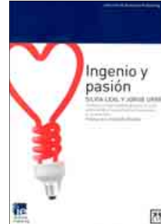
Ingenio y pasión Autor: Silvia Leal y Jorge Urrea Editorial: Lid

Crear tu propio negocio no sabe de edades. Los autores animan a cualquier profesional a poner en marcha su idea empresarial y recuerdan que la mayoría de los nuevos proyectos proceden de personas en la mitad de su vida profesional. Para iniciar esta aventura prestan especial atención a la estructura empresarial más adecuada.