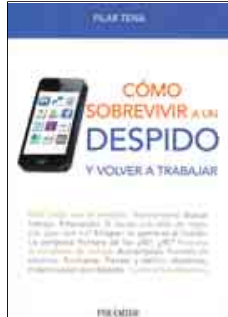
Cómo sobrevivir... Autor: Pilar Tena Editorial: Pirámide

Independientemente de su orientación, la mayoría de ellos tienen como nexo común incitar a la acción, a salir de la zona de confort y perder el miedo a afrontar nuevos retos para ser los únicos en dirigir su carrera.